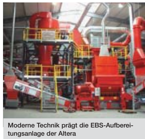
Moderne Technik prägt die EBS-Aufbereitungsanlage der Altera

Während der anschließenden Führung durch die Altera-Anlage und die Annahmehalle der HOLLICIM überzeugte man sich von der hohen Materialqualität und der aufwendigen Technik.