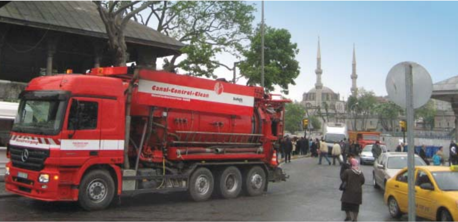
Ein Fahrzeug der Canal-Control + Clean im internationalen Einsatz: Die Zusammenarbeit mit der Stadt Istanbul soll bis Mai 2009 fortgesetzt werden

Die Canal-Control + Clean Umweltschutzservice GmbH wird ihren derzeitigen Auftrag zur Großprofilreinigung in verschiedenen Stadtteilen der Stadt Istanbul (Türkei) voraussichtlich vor Ende dieses Jahres erfolgreich abschließen. In den vergangenen zwei Jahren wurden sehr gute Geschäftsbeziehungen zum Konsortiumspartner MVM Construction und zum Auftraggeber ISKI (Stadtentwässerung Istanbul) aufgebaut. Diese positive Zusammenarbeit soll mit Folgeprojekten fortgesetzt werden.