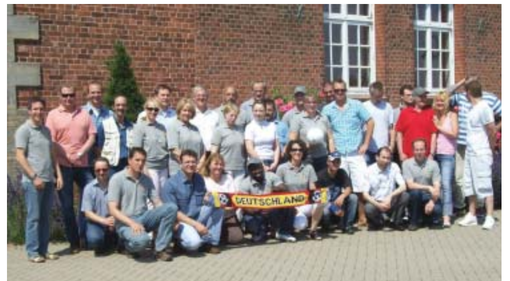
Geschlossene Mannschaftsleistung: das BESTSORT-Team zu Gast in Wischhafen