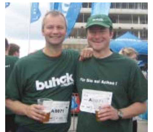
Die Chefs beim HSH Nordbank Run

beim Rathaus-Cup nahtlos an ihre Leistung angeknüpft. Der Spaß auf der Sportanlage des SC Wentorf war groß.