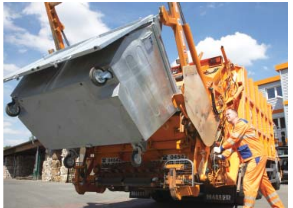
Neue Aufträge – mehr Arbeit: Abfallsammlung für die Sortieranlage in Grambek

Schwerin und Ostholstein. Die GWA sortiert dieses enorme Aufkommen in zwei Schichten und wird den einen oder anderen Samstag zusätzlich die Sortieranlage laufen lassen müssen, um Übermengen und Feiertage auszugleichen. Die Sortieranlage in Grambek freut sich jedoch über diese „Mehrarbeit“, denn für 2008 wird damit eine annähernde Vollausslastung erreicht.