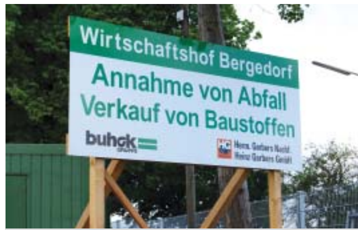
Sämtliche Baustoffe wie Kies, Sand oder Betonmineralgemische lassen sich ab sofort am Wirtschaftshof Bergedorf beziehen

Im April nahm der Wirtschaftshof Bergedorf an der Randersweide 91a seinen Betrieb auf.