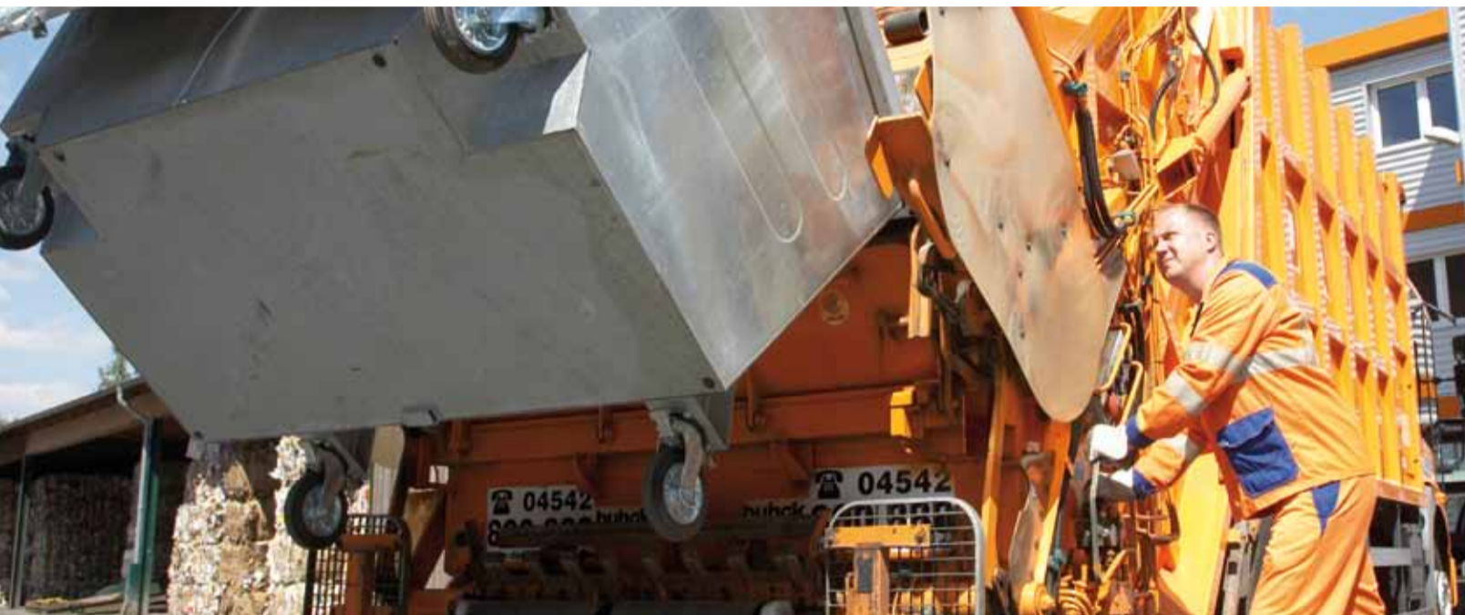
Leerung eines Abfallbehälters. Im Hintergrund sind die sortierten, zu Ballen gepressten Wertstoffe zu erkennen.